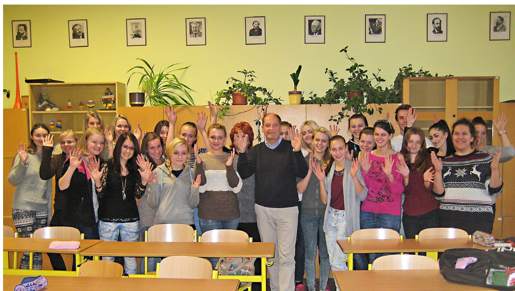
Po semináři studentky tleskaly pomocí symbolu „vzhůru ruce“ světové kultury neslyšících na Střední pedagogické škole v Boskovicích.

Na přednášce „ČR strategicky pomáhá v Moldavsku, potřebovala by také pomoci tamním osobám se sluchovým postižením“ jsme představili tamní situaci laikům i odborníkům pomocí ukázek dokumentů i prezentace před publikem. Hodně návštěvníků se ptalo a chtělo více vědět o situaci neslyšících v Moldavsku, než o Rozvojových cílech tisíciletí.